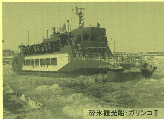
砕氷観光船:ガリンコII