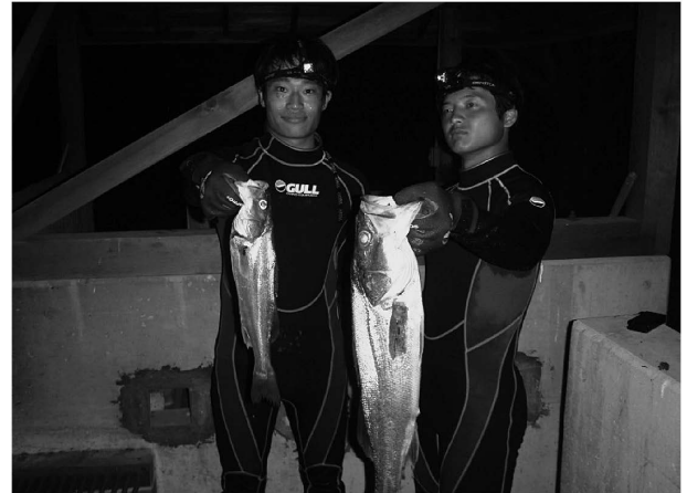
Figure 7. Piscivorous fishes collected by nighttime survey at seagrass bed in Seto Inland Sea, Japan.

藻場で調査をするうちに、魚類群集が昼夜間で大きく異なることがわかってきた。夜間には魚食性魚類がアマモ場・ガラモ場を訪問し、稚魚や小型魚類をさかんに捕食していることを明らかにできた一方で（Kinoshita et al., 2014）、大きな衝撃も受けた。稚魚や小型魚にとって「ゆりかご」であるはずの藻場が、夜間には捕食者（魚食性魚類）の摂餌場となっているのだ（Fig. 7）。調査を通じてこのような現