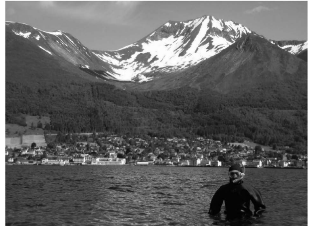
Figure 4. Survey at seagrass bed in Norway in summer with mountains in the back covered with ice and snow.

2006年に広島に赴任した直後は、魚類生産を評価することを研究の柱として、多くのフィールド調査と飼育実験を