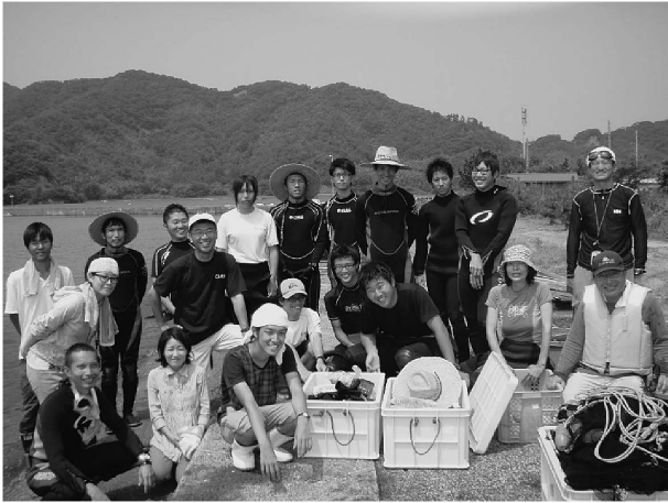
Figure 8. Survey for Water–Energy–Food Nexus Project of Research Institute for Humanity and Nature at Obama Bay, Japan.