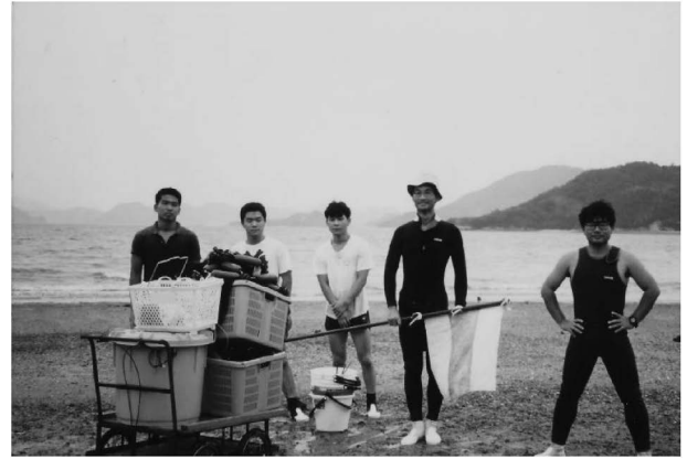
Figure 2. Survey for distribution and recapture rate of cultured juvenile red sea bream Pagrus major after release at Momoshima Island, Hiroshima Prefecture.

世界の閉鎖性海域のなかでも高い漁業生産をほこる瀬戸内海（岡市ほか、1996）の中央部付近に、現在の職場である広島大学大学院生物圏科学研究科竹原ステーション（旧水産実験所）は位置する。周辺には多くの島が点在し、瀬戸内海のなかでも自然海岸が比較的多く残されたエリアである。2006年2月に赴任してからおよそ12年間、フィールド調査、飼育実験などを実施してきた。自身の研究と海のつながりを初めて実感したのは、1993年夏にさかのぼる。卒業研究の指導教員（田中 克教授、京都大学農学部水産生物学研究室、当時）から「まずは現場を経験するのがよい」と勧められたのが、種苗生産の実習生（現在の長期インターンシップ制度のようなもの）であった。水産世界の右も左もわからなかった著者を受け入れていただいた日本栽培漁業協会伯方島事業場（現、瀬戸内海区水産研究所伯方島庁舎）の福永辰広場長（当時）と事業場スタッフの暖かい指導のもと、マダイ、キジハタ、オニオコゼ等の種苗生産をお手伝いした。期間中に百島実験地（現、百島庁舎）でのマダイ種苗放流・追跡調査に参加し、山本義久さん