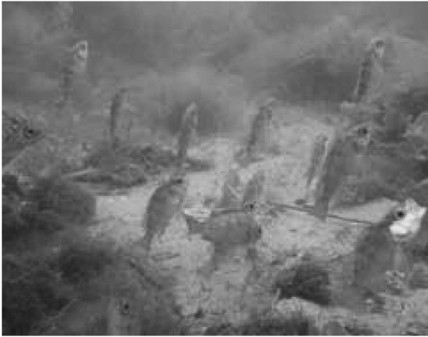
Figure 1. Fish that are major components of biological production of seagrass and macroalgal beds.

るであろう。そのためには、各生態系内における生物生産プロセスの定量評価に加えて、異なる生態系間の物質・生物の移動実態の解明など広域的・包括的な視点も不可欠である。漁業資源を含めた生態系サービスを持続的に活用するためには、生態系が有する様々な機能をよく理解し、環境特性や地域の社会状況に応じた対策を講じる必要がある。