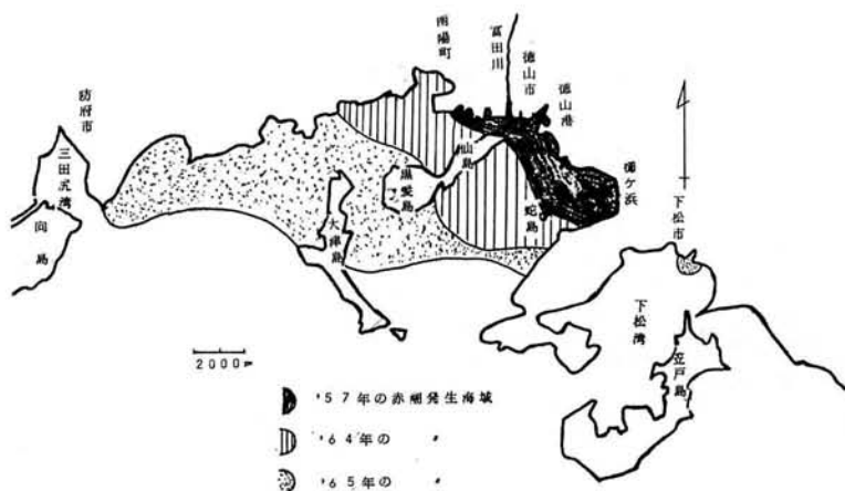
オ1図 赤潮発生海域。