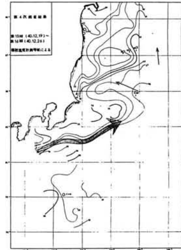
第3図 黒潮調査表面水温図：太矢印は黒潮推定水路、細矢印は同上分枝。

これらの調査から40年11月から41年3月迄及び41年夏~秋の海況及びその変動が明らかにされ、温度傾度及び潮目の分布状態から黒潮の流路及